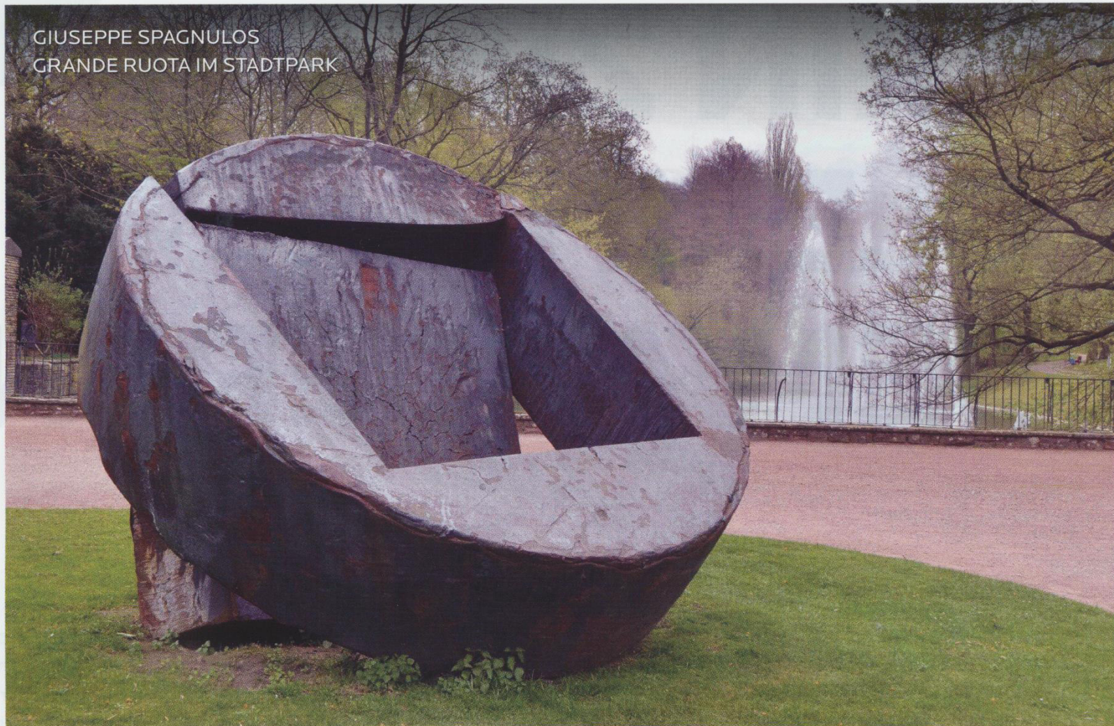
GIUSEPPE SPAGNULOS GRANDE RUOTA IM STADTPARK

nen gibt es aber nichts – außer Erfahrung. Bei uns ist der Weg das Ziel“, so Krauß. Ein kleiner Einblick: „Auf den ersten Blick bin ich ein riesiges Rad aus Eisen. Wenn man genau hinguckt, sieht man aber, dass der Künstler aus meinem inneren Teil ein Quadrat herausgeschnitten hat, welches dafür sorgt, dass ich aufrecht stehen kann. Wenn ihr euch mir ein bisschen nähert, werdet ihr erkennen können, dass das Eisen, aus dem ich geschaffen bin, mit Feuer bearbeitet wurde.“ Welches Kunstwerk im Stadtpark ist gemeint?