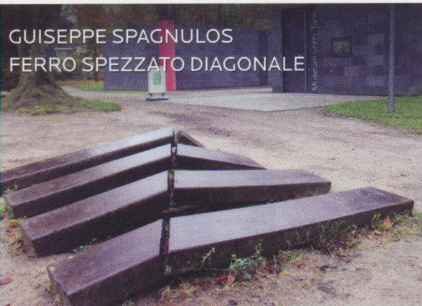
GIUSEPPE SPAGNULOS FERRO SPEZZATO DIAGONALE