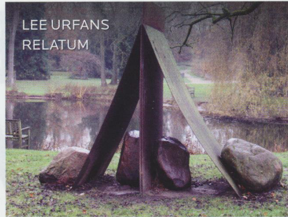
LEE URFANS RELATUM