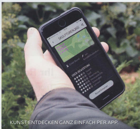
KUNST ENTDECKEN GANZ EINFACH PER APP.