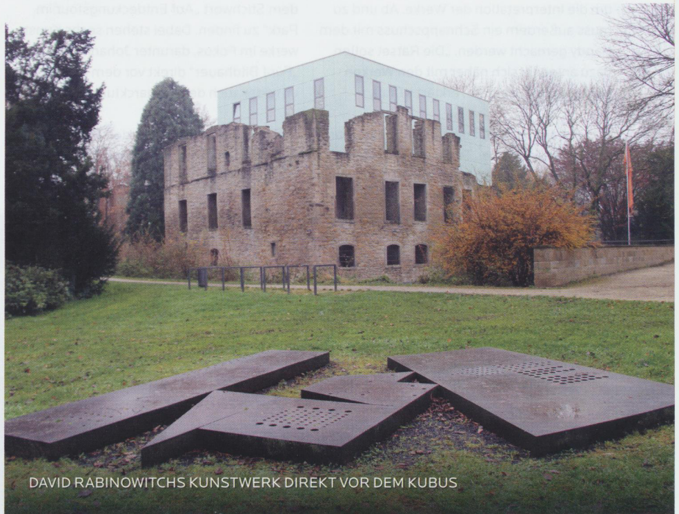
DAVID RABINOWITCHS KUNSTWERK DIREKT VOR DEM KUBUS

Nutzer der Actionbound-App können unter dem Stichwort „Skulpturenjagd“ den Rundgang im Schlosspark finden. Einmal reingeklickt, gilt es, 18 Fragen oder interaktive Aufgaben zu lösen. Die User können auf einer Karte ihren Standort einsehen und sich per GPS zu den elf Kunstwerken rund um den Kubus im Haus Weitmar führen lassen. Dabei können die